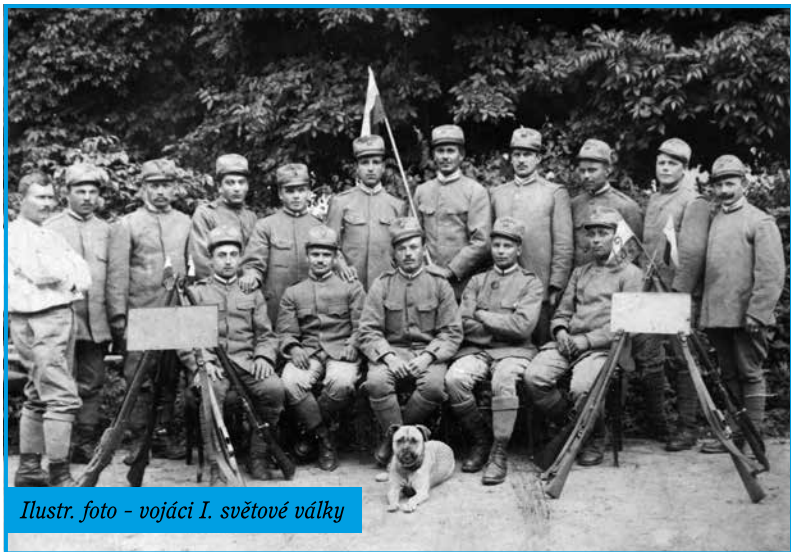
Ilustr. foto - vojáci I. světové války

po snídani jsme se zakopávali níže do zemi proti nepříteli. To bylo v pondělí a pak jsme měli celý den volno, jenom malé přestřelky, menáž nebyla žádná celý den, až večír v 10 hodin jsme dostali polévku a kousek masa. Ráno dne 3/8. o ½ 2 hodině jsme dostali kávu a měli jsme dost klidný den, mimo několik ran z děla, ale o 6 hodině večer nastala opět prudká bouře z děla a s toho tam přiletěl ruský aeroplán a německá