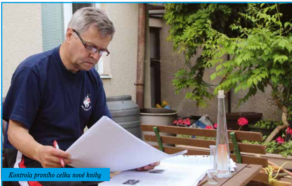
Kontrola prvního celku nové knihy

Tehdy jsem postupně navštívil řadu z Vás spoluobčanů, zpracoval vlastní plánované texty, nastudoval materiály k textům, které jsem si v knize přál, ale které neměly autora, a tak jsem je napsal... Počátkem května jsem pořídil fotografie mnohých kolektivů, prošel vlastní fotoarchiv i poskytnuté fotomateriály. Byly to tisíce prohlédnutých fotografií z různých období, byly to desítky hodin procházení knih a dokumentů, byly to stovky hodin psaní, doladování i opravování textů. Byla to náročná, ale velmi krásná a zavazující práce.“