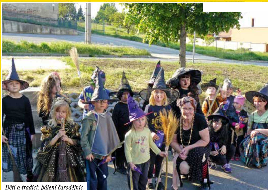
Děti a tradici: pálení čarodějnic