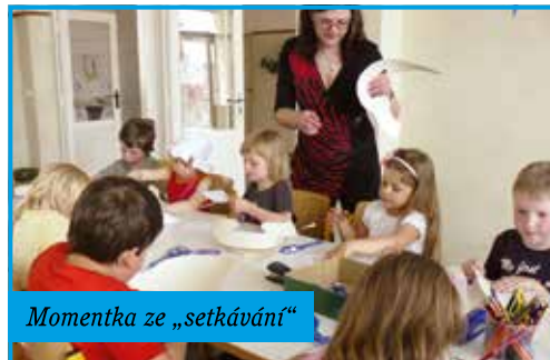
Momentka ze „setkávání“

ve třídě s přípravou na budoucí výuku a slavnostní pasování budoucích prvňáčků.