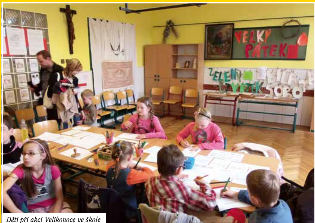
Děti při akci Velikonoce ve škole