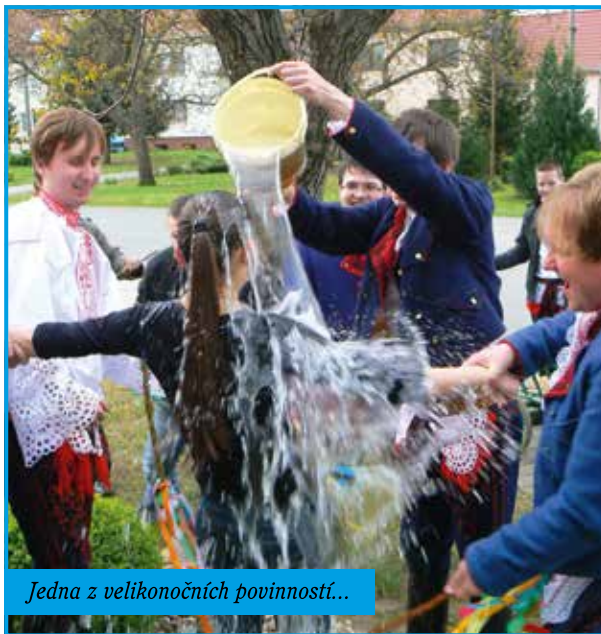
Jedna z velikonočních povinností...

Nejprve však bylo se řádně připravit. Čili uplést žile, oprášit velikonoční písně a domluvit se na časovém harmonogramu. Velikonoce však nejsou pouze o pondělní obchůzce, nýbrž podstatný je jejich duchovní rozměr. Ten jsme vyplnili krojovou účastí na slavnostní nedělní bohoslužbě. Počasí pro obchůzku zcela jistě stranilo mužům, neboť se vydařilo a my již od časného rána mohli počastovat „milou návštěvou“ naše členky. Písně „Po šlaháče chodíme“ či „Hore dědinů“ se snad krásně nesly obcí, šohajci z krúžku nadšeně plnili svou velikonoční povinnost. Zajímavým zpestřením byla také nečekaná návštěva fotografa z MF Dnes, který pro úterní výtisk vytvořil vskutku do puntíku naaranžovanou fotografii. Ač jsme se snažili být jemnými šlaháči, všem dívkám se za případně způsobené fyzické a emoční újmy omlouváme ☺.