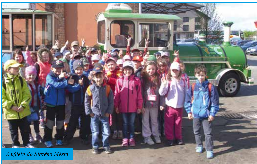
Z výletu do Starého Města

Recyklace, ochrana životního prostředí. V rámci celoškolního projektu Den Země - Uklid si svou obec navštívili žáci 1. a 2. ročníků Kovosteel ve Starém Městě u Uherského Hradiště. Děti se zde vhodnou a zábavnou formou seznamovaly s možnostmi zpracovávání, třídění i recyklací různých druhů odpadů.