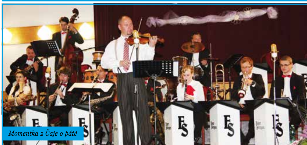
Momentka z Čaje o páté