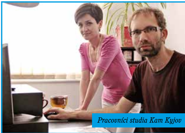
Pracovníci studia Kam Kyjov