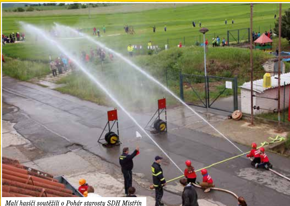
Malí hasiči soutěžili o Pohár starosty SDH Mistrůn