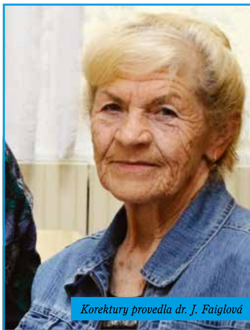
Korektury provedla dr. J. Faiglová

„I přesto jsem textovou část dokončil v polovině měsíce května. Výběrem konečného zpracovatele a tiskárny začala konkrétní finalizace celého díla. Texty bylo třeba doplnit fotografiemi, celou knihu několikrát přečíst, opravit a ve studiu správně zařadit a tzv. zalomit. Tyto práce byly ukončeny dle stanoveného plánu 10. června. O den později byla předtisková data předána tiskárně a začal tisk celé knihy. Knihařské zpracování publikace bylo zahájeno 20. června. Tím byly splněny všechny předpoklady,