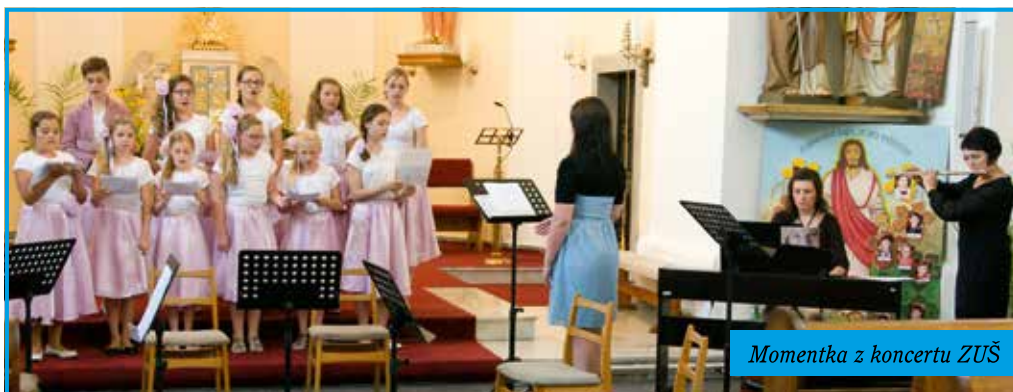
Momentka z koncertu ZUŠ