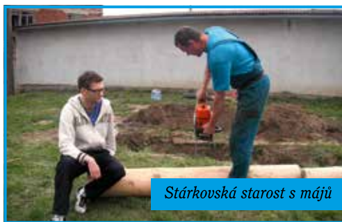
Střrkovskř starost s mřjř

Mřt cimbřlovou muziku je velmi dřleũitě, o tom netřeba spekulovat. Vřhledem k tomu, co nřř čekř v nadchřzejřch męsřicřch, budeme jejj sluřby hojně vyuřřvat. Nejbliřř vystoupenř bude na počřtku července, kdy nřře obec slavř pade-