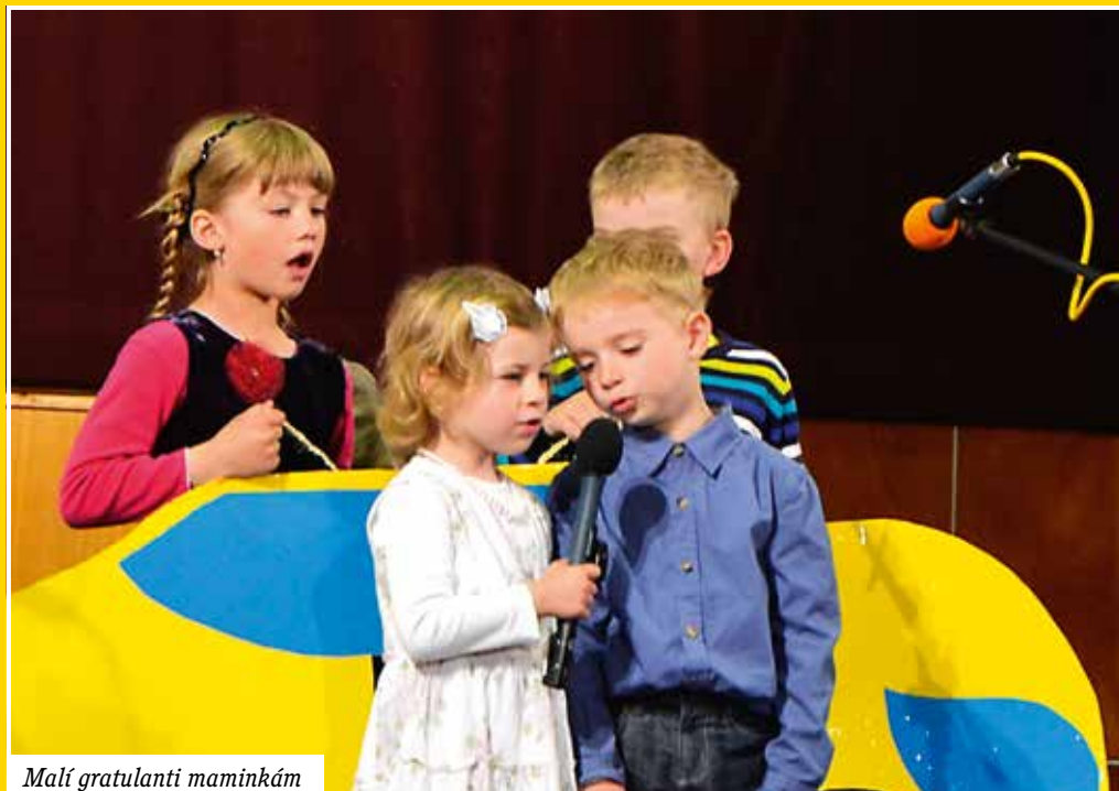
Malí gratulanti maminkám