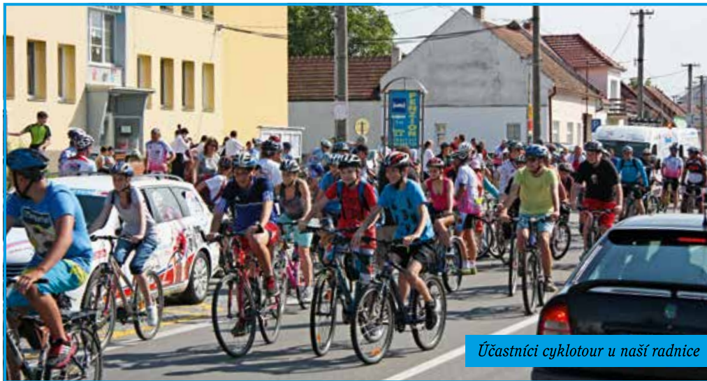
Účastníci cyklotour u naší radnice