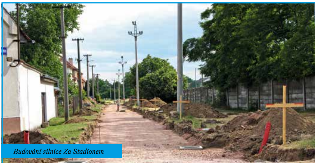
Budování silnice Za Stadionem