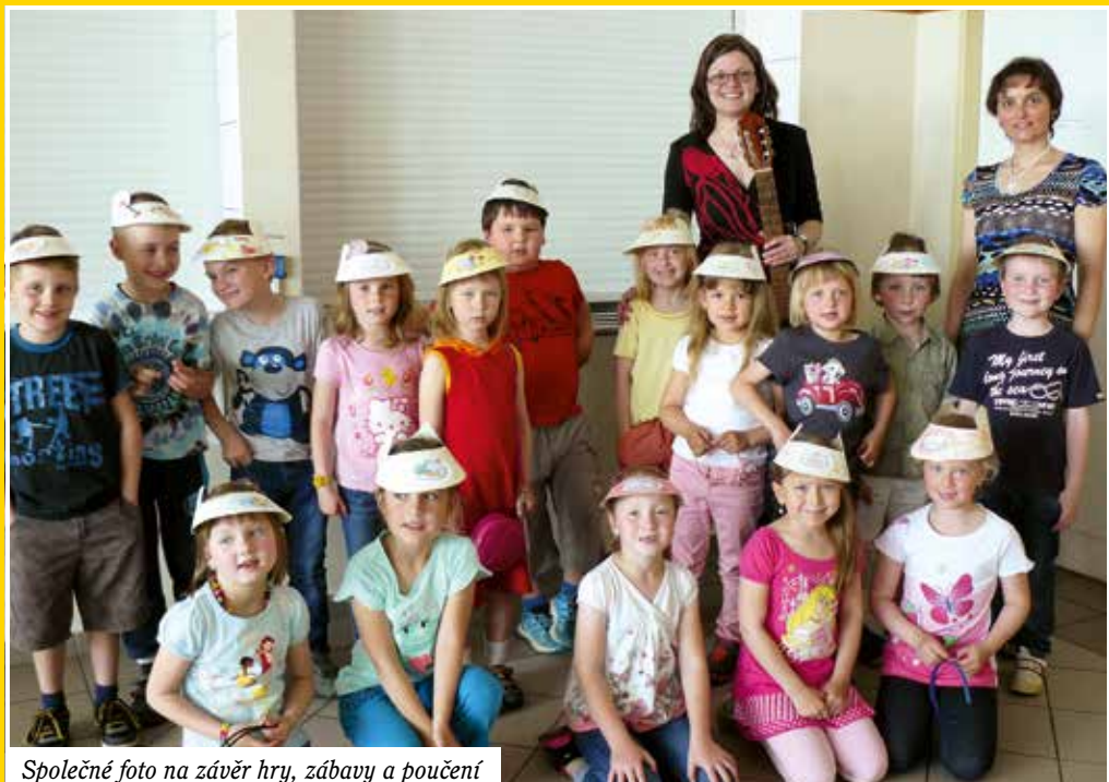
Společné foto na závěr hry, zábavy a poučení