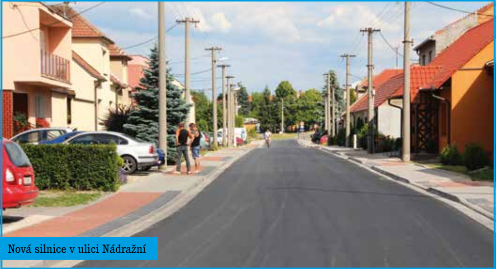
Nová silnice v ulici Nádražní

Tento zpravodaj je z několika důvodů trochu výjimečný. Zkoušíme pozměnit jeho název. Hned v oslovení je změna názvu patrna. Dříve jsem začínal několika slovy o počasí. Teď je to obsaženo hned v názvu. Další výjimečností jsou události, které proběhly v předcházejících měsících a pak, které nás čekají v letních měsících. Jaro se přihlásilo netypickým projevem, následovalo ochlazení a dešť.