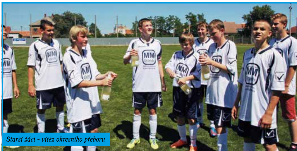
Starší žáci - vítěz okresního přeboru

tito naši nejmenší mají chuť hrát a dokázat, že se ve fotbalovém světě neztratí. Bylo by hezké, kdyby z jejich řad dokázali vyrůst velcí hráči svatoborské kopané. Přípravka, žáci a mládež obecně jsou naší velkou nadějí, že za několik let, až dorostou, budou předvádět krásný fotbal i mezi muži a i jejich zásluhou budeme pořád bojovat o příčky nejvyšší.