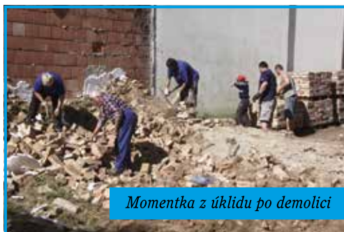
Momentka z úklidu po demolicí

V plánu činnosti na rok 2014 jsme si schválili spolupráci při demolicí domu „Mackovo“ - vedle DPS (domu s pečovatelskou službou). Po vyřízení nezbytných povolení a dohod jsme se v pondělí 26. května pustili do demolicí. Celý týden po odpadních jsme postupně odstranili křídlice, krovy, trámy a čistili cihly. Stroje na bourání a odvoz