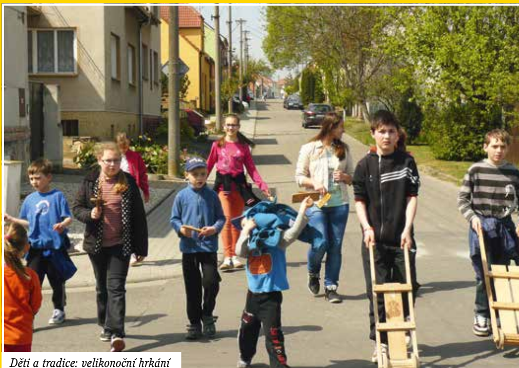
Děti a tradice: velikonoční hrkání