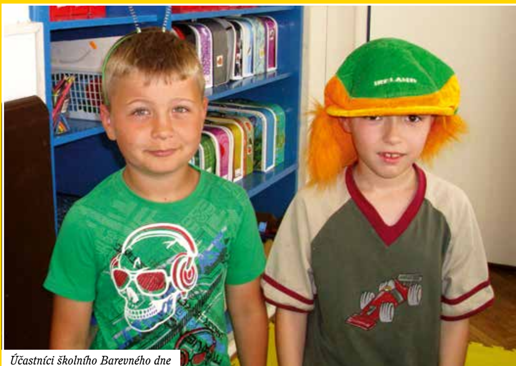
Účastníci školního Barevného dne