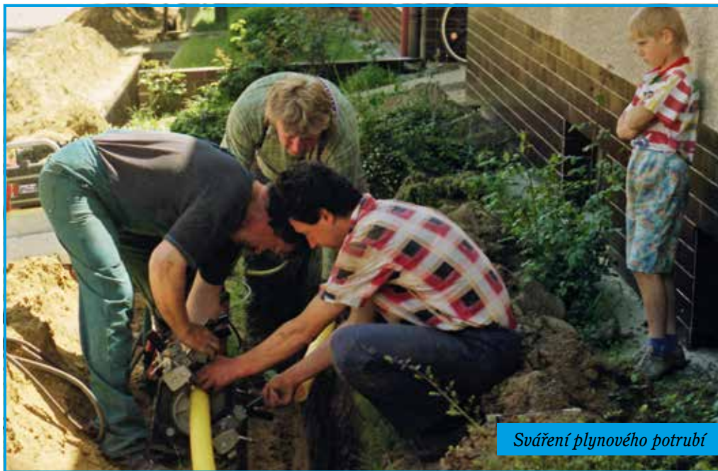
Sváření plynového potrubí