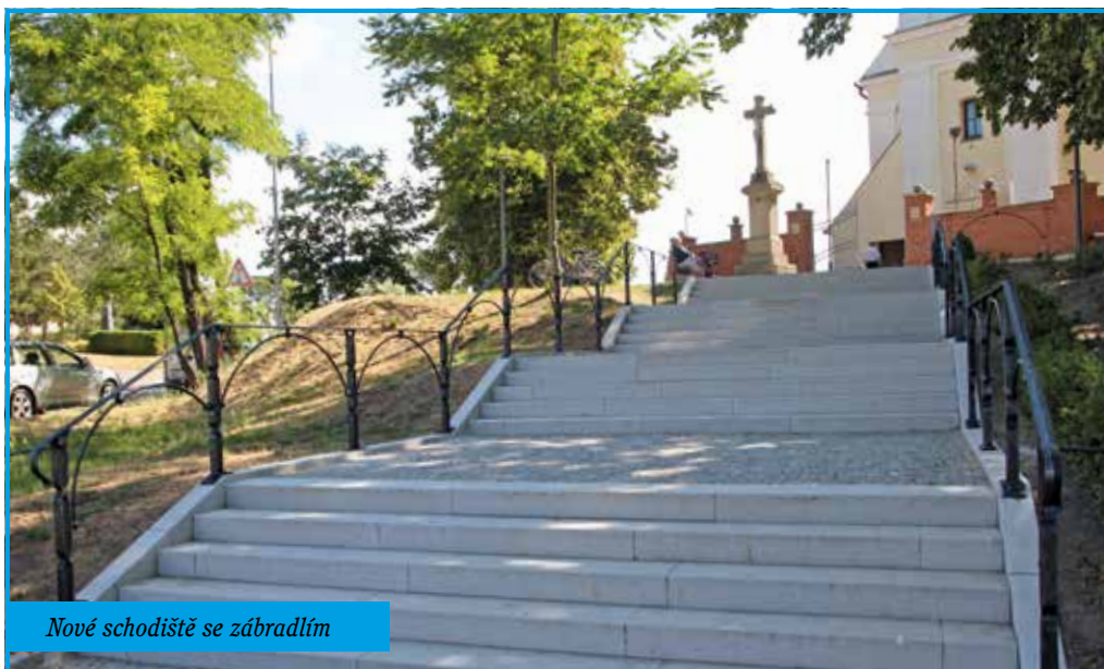
Nové schodiště se zábradlím

hodně o své obci dovědět. Každý občan i rodák by měl historii obce znát tak, jak to napsal František Palacký v knize Dějiny národa českého (do roku 1526). Pak následovalo 392 let habsburské poroby. Dvacet sedm českých pánů, zástupců českých stavů, bylo na Staroměstském náměstí popraveno. Řada velkých osobností musela ze země odejít. Jako například Jan Amos Komenský - učitel národů. Jejich díla byla spálena katolickou inkvizicí. Pro doplnění třeba Karel Havlíček Borovský.