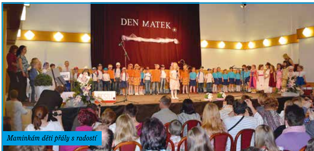
Maminkám děti přály s radostí

Ani se tomu nechce věřit, ale už si ve školce zpíváme oblíbenou písničku: „Léto hraje na kamínky v potoce...“, a to znamená, že prázdniny jsou za dveřmi. Ale do poslední chvíle bylo ve školce veselo a živo.