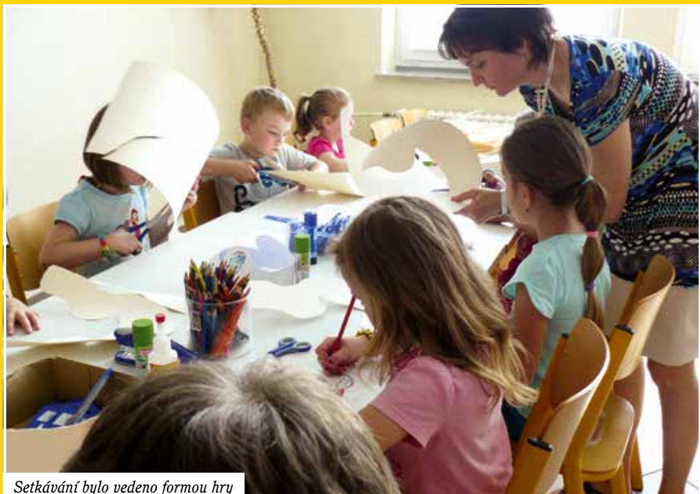
Setkávání bylo vedeno formou hry