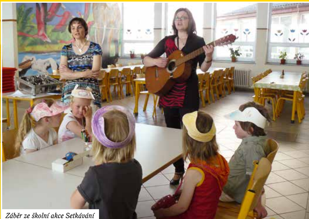
Záběr ze školní akce Setkávání