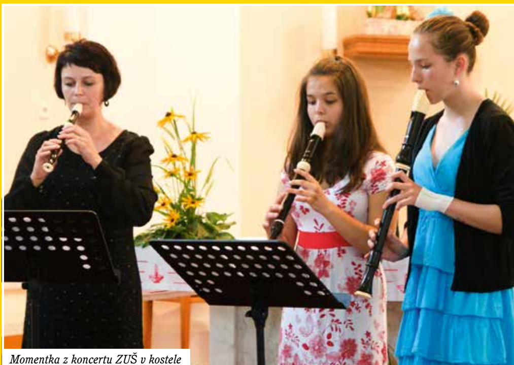
Momentka z koncertu ZUŠ v kostele