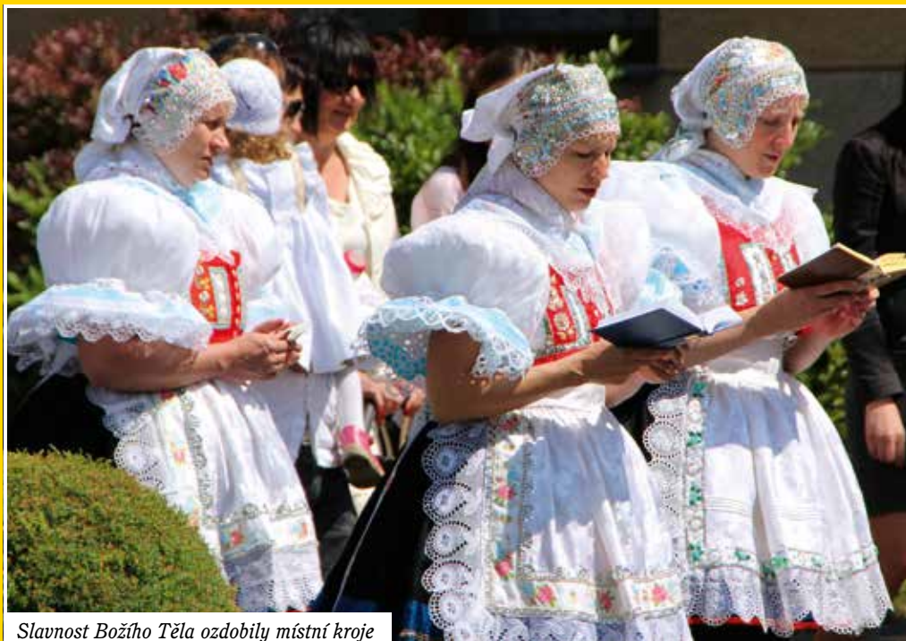
Slavnost Božího Těla ozdobily místní kroje