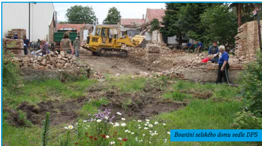
Bourání selského domu vedle DPS

Vážení spoluobčané, opět Vám přináším informace z aktuálního dění v obci.