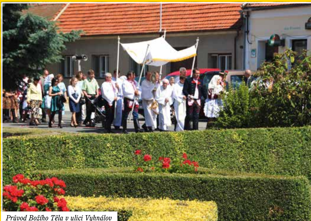
Průvod Božího Těla v ulici Vyhnálov