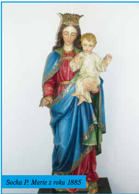
Socha P. Marie z roku 1885