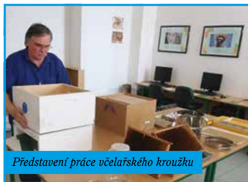
Představení práce včelařského kroužku

ve třídě s přípravou na budoucí výuku a slavnostní pasování budoucích prvňáčků.