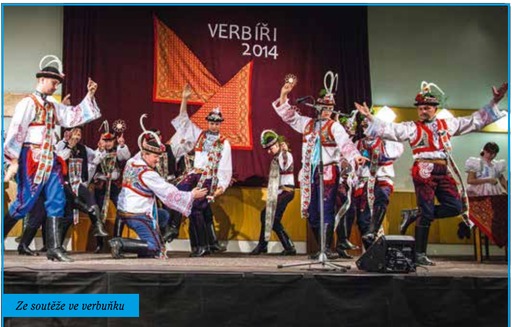
Ze soutěže ve verbuňku

Na konci dubna jsme stárkům pomohli vztyčit máj a společně se pobavit na zábavě uspořádané souborem Mistřín.