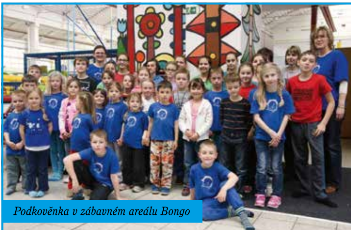
Podkověnka v zábavném areálu Bongo