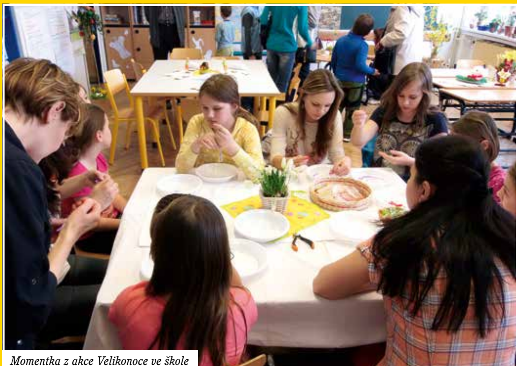
Momentka z akce Velikonoce ve škole