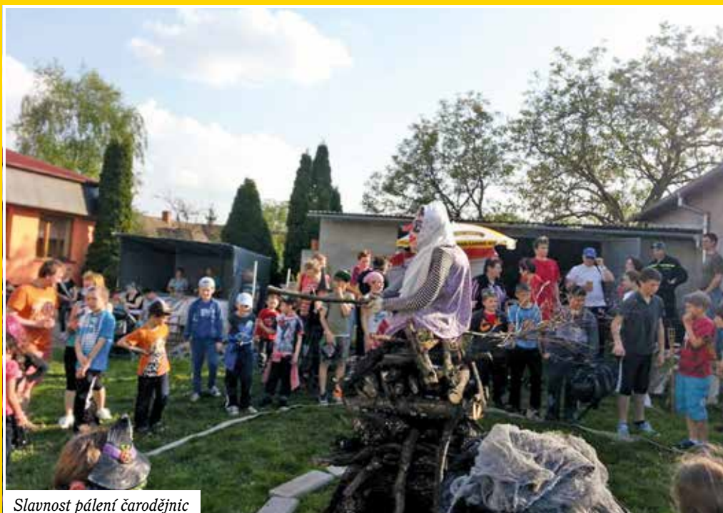
Slavnost pálení čarodějnic