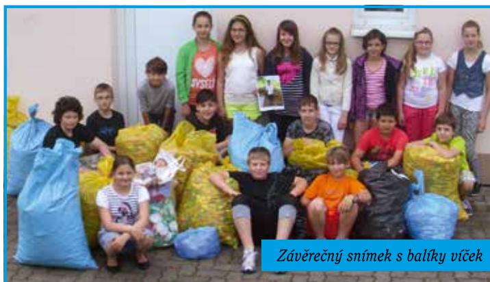
Závěrečný snímek s balíky víček