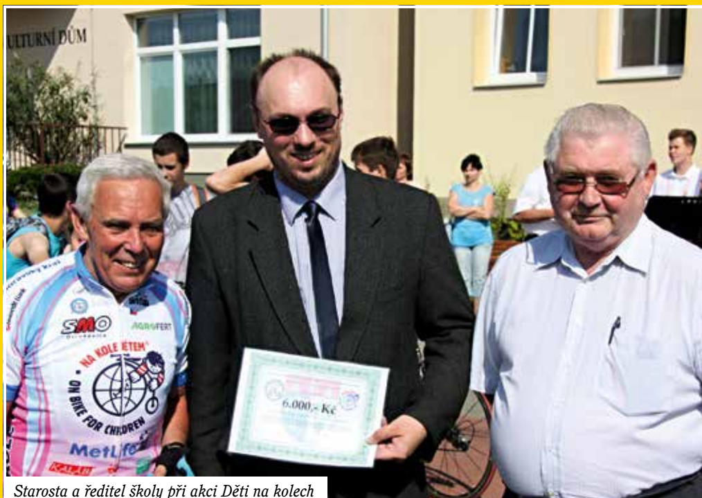
Starosta a ředitel školy při akci Děti na kolech