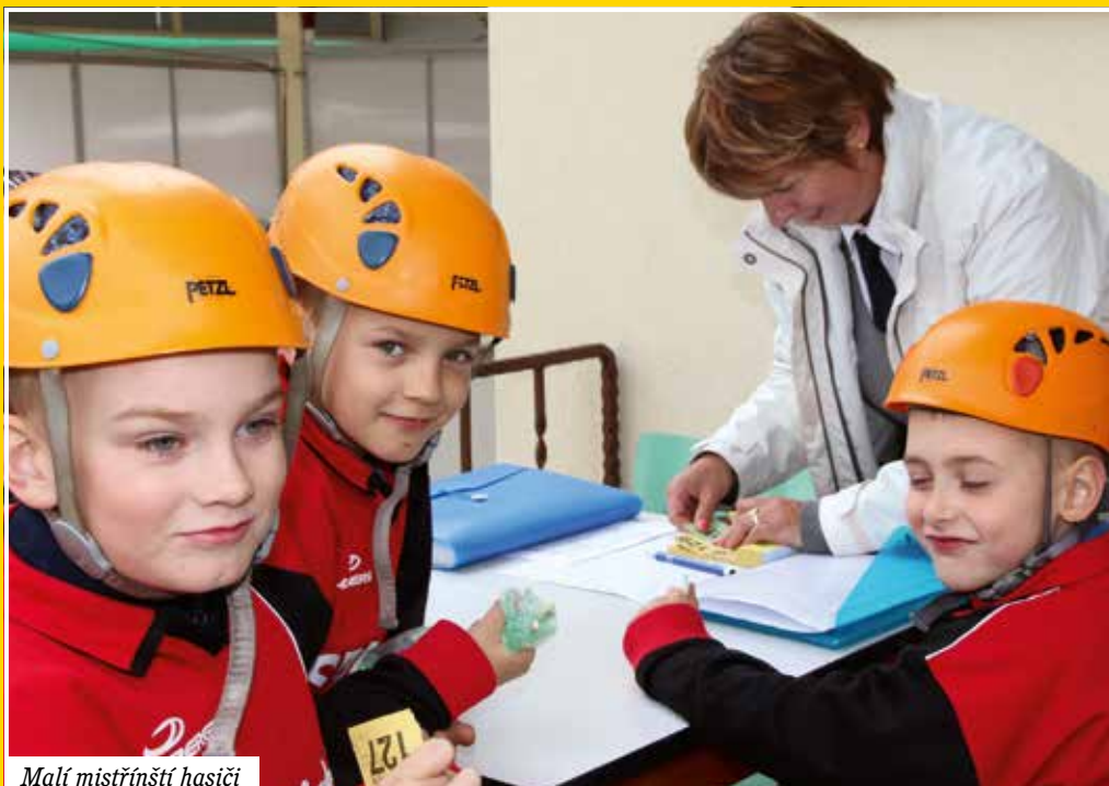
Malí mistřiňští hasiči