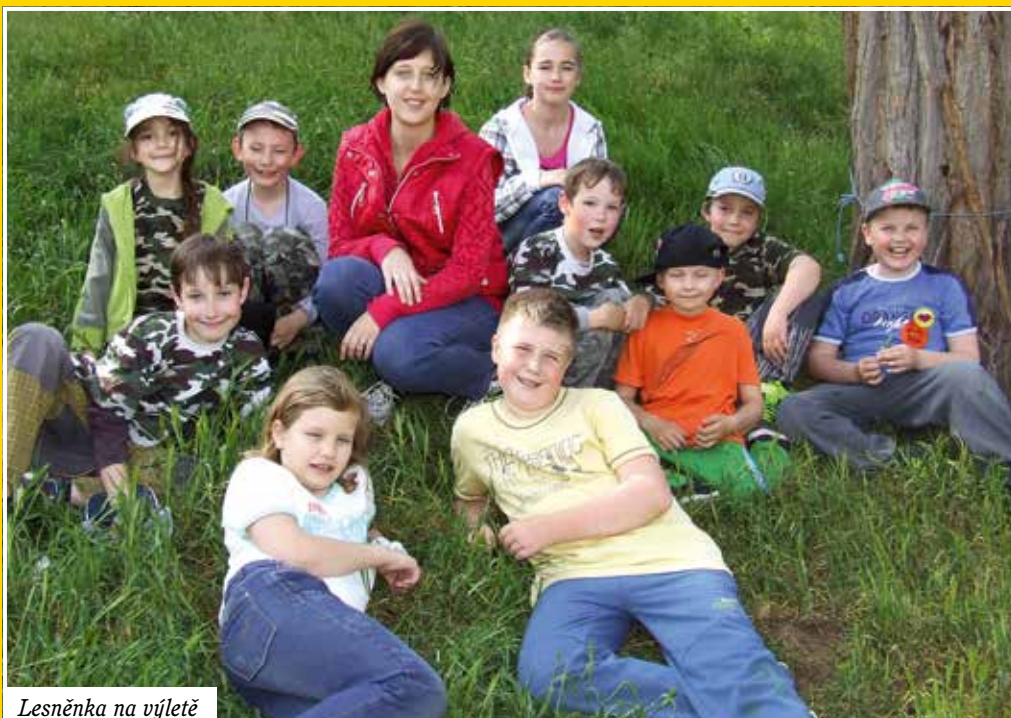
Lesněnka na výletě