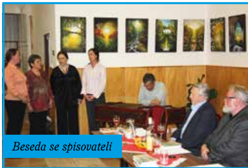
Beseda se spisovateli