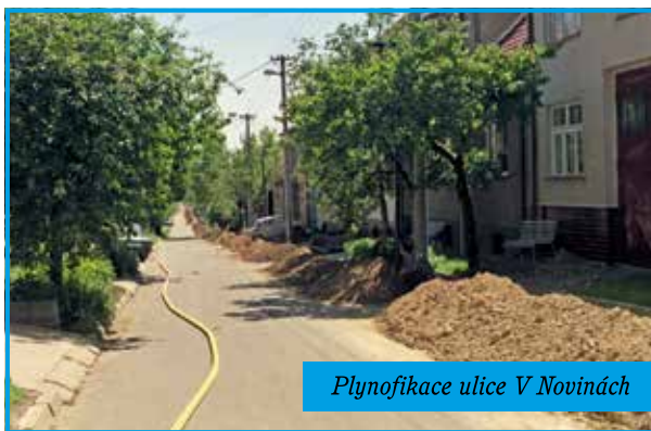
Plynofikace ulice V Novinách

Napojení na stávající rozvody vysokotlakého ZP bylo zvažováno v Kyjově na konci ulice Svato-