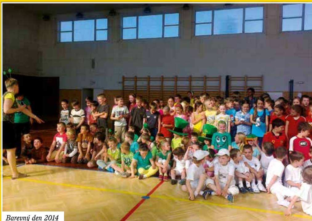
Barevný den 2014