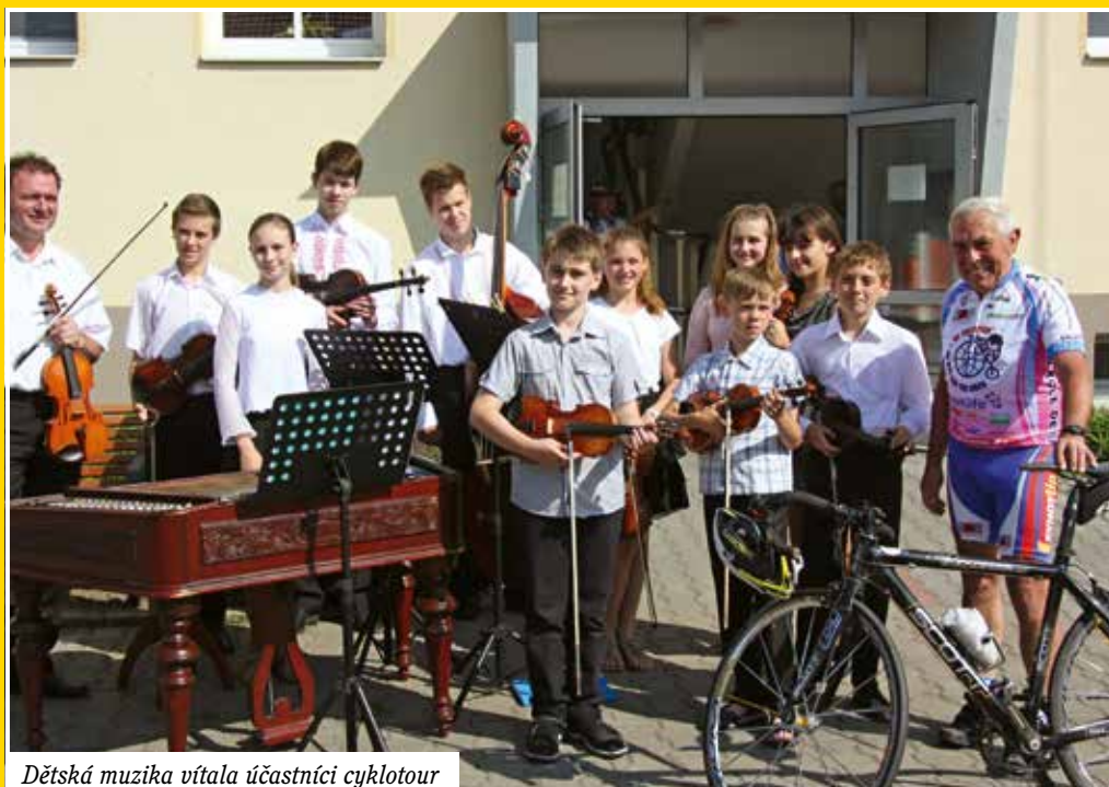
Dětská muzika vítala účastníky cyklotour