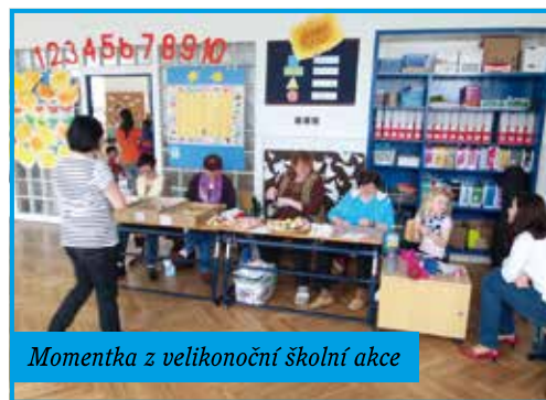
Momentka z velikonoční školní akce

Škola během tohoto tvořivého odpoledne chtěla veřejnosti prezentovat dovednost a šikovnost svých žáků v mnoha oblastech, ukázat inovativní, moderní formy a metody práce, modernizaci vybavení školy. Celý projektový den byl výsledkem vzájemné spolupráce žáků, pedagogických pracovníků, vedoucích zájmových útvarů a rodičů.