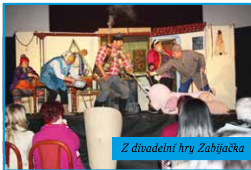
Z divadelní hry Zabijačka