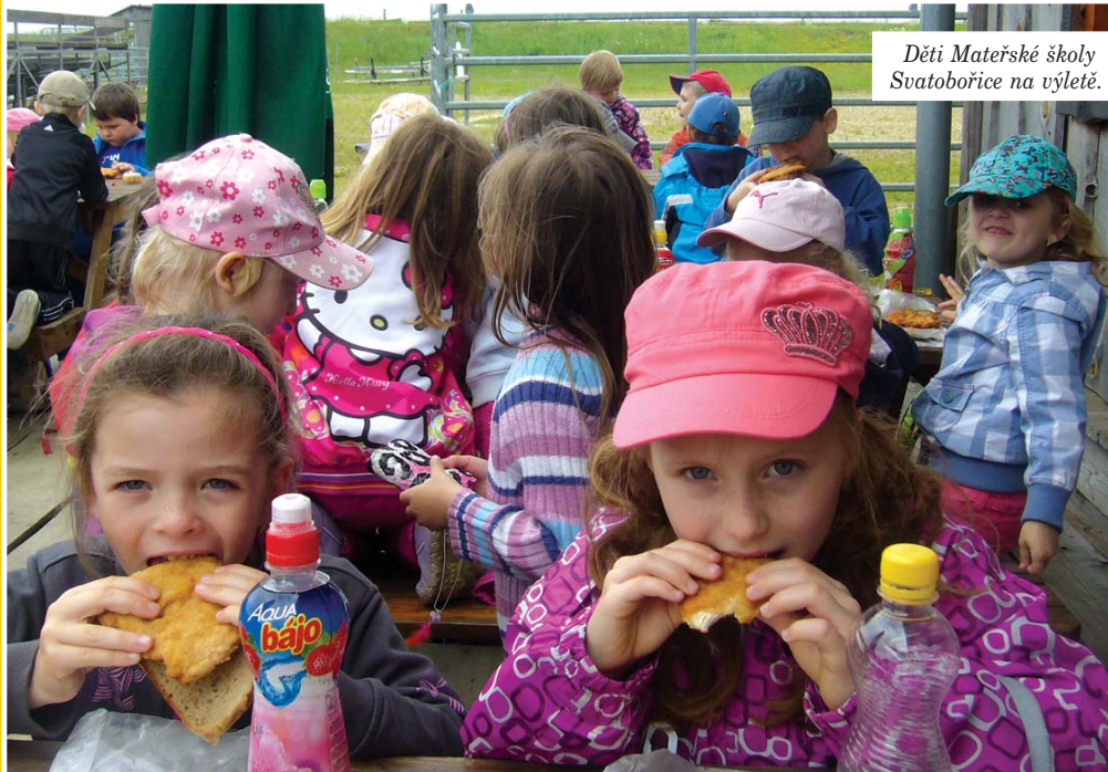
Děti Mateřské školy Svatobořice na výletě.