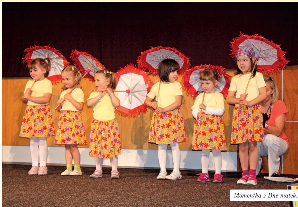
Momentka z Dne matek.