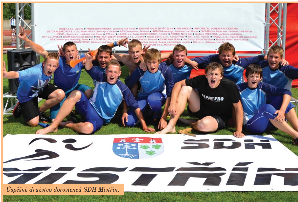
Úspěšné družstvo dorostenců SDH Mistřín.