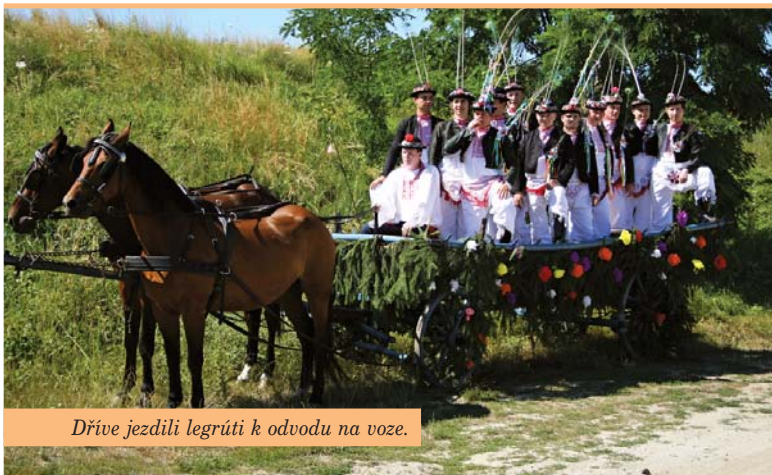
Dříve jezdili legrúti k odvodu na voze.