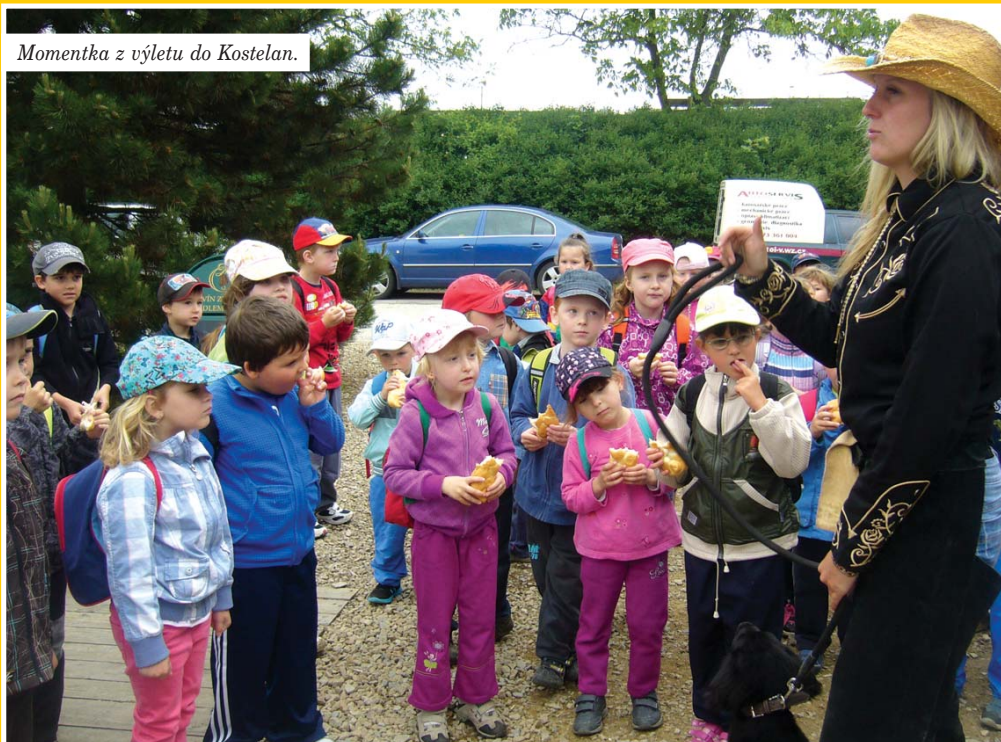
Momentka z výletu do Kostelan.