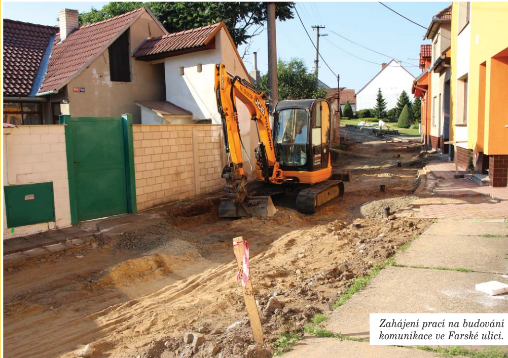
Zahájení prací na budování komunikace ve Farské ulici.