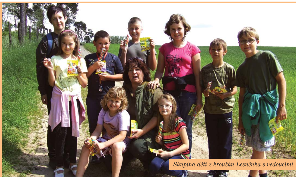
Skupina dětí z kroužku Lesněnka s vedoucími.

Zájemové činnosti pro děti školou povinné není nikdy dost, a proto vznikl při ZŠ Svatobořice-Mistřín Myslivocko-lesnický kroužek Lesněnka.