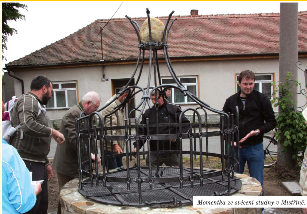
Momentka ze svěcení studny v Mistříně.