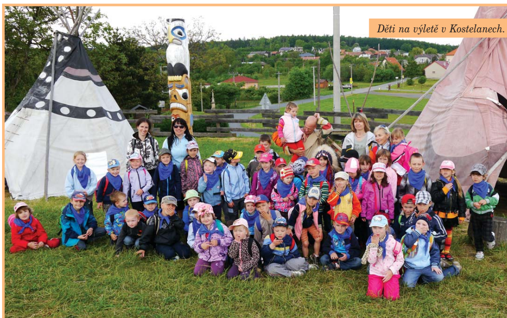
Děti na výletě v Kostelanech.

V polovině června se konečně počasí umoudřilo a mohla být uskutečněna přátelská návštěva k dětem do školky ve Svatobořicích.