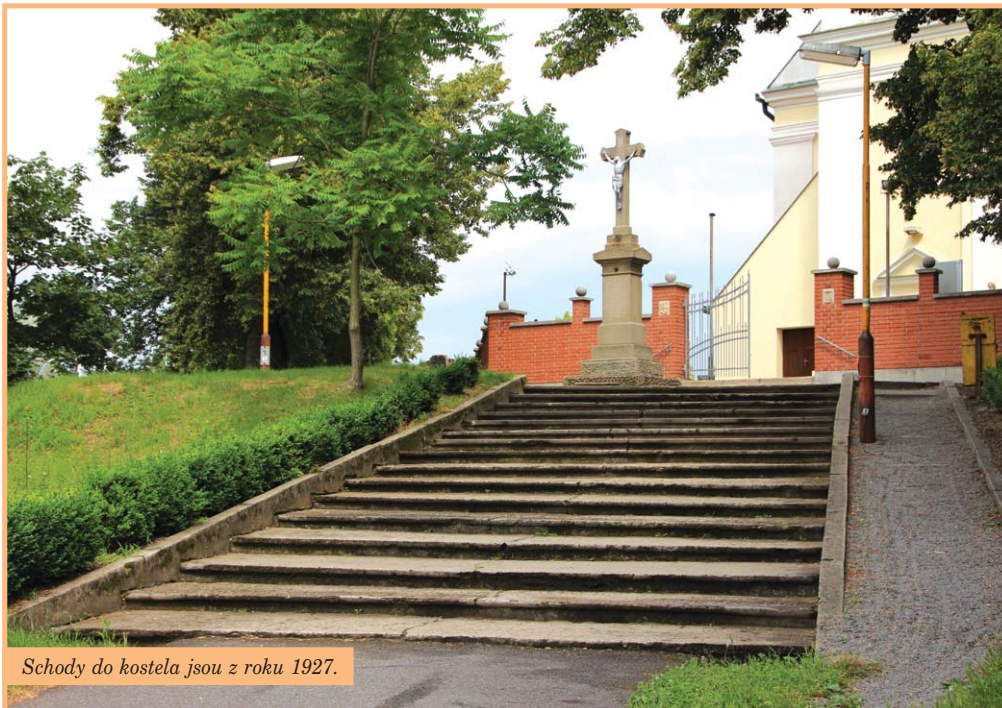
Schody do kostela jsou z roku 1927.

něco jiného stavět nebude, pokud oni sami tam něco podobného nezřídí. Předpokládám, že obec jim k něčemu podobnému, po mém odchodu, nikdy souhlasné stanovisko nedá. Pokládám to za svoje „Krédo“, tedy „Věřím“.