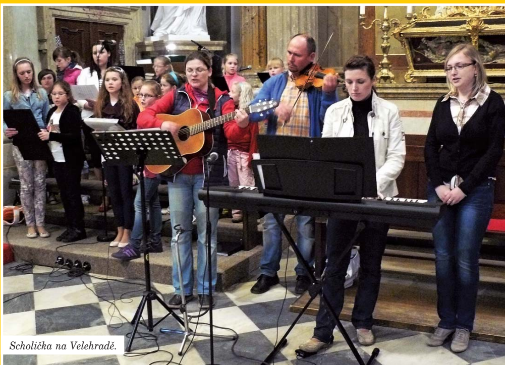
Scholička na Velehradě.