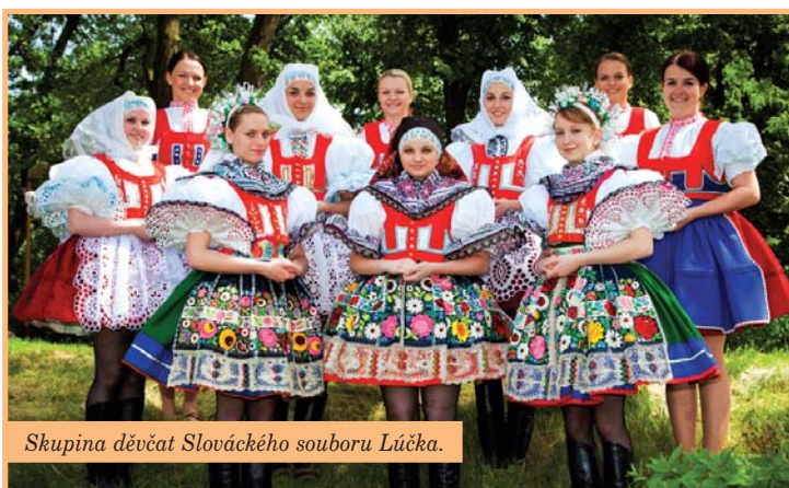
Skupina děvčat Slovůckého souboru Lůčka.

Rád bych se ale ohlédl za uplynulým obdobím v našem souboru. První velkou jarní akcí bývají tradičně Velikonoce a s nimi spojená občůzka chlapců s pomlůzkami. Ačkoli se letošní svůtky jara ocitly docela nečekáně pod sněhovou pokrůvkou, musím říct, že se nám naše zpívání a „šlahání“ opět povedlo.