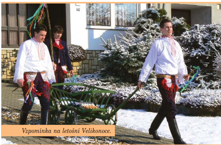
Vzpomínka na letošní Velikonoce.

Ačkoliv zima se tento rok rozhodla protáhnout své panování až takřka do března, Slovácký krúžek zimní spánek ukončil mnohem dříve, respektive, pokud se poohlédnu důkladně, tak ani v pod-