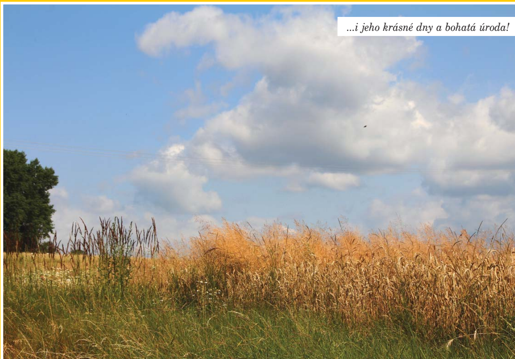
...i jeho krásné dny a bohatá úroda!