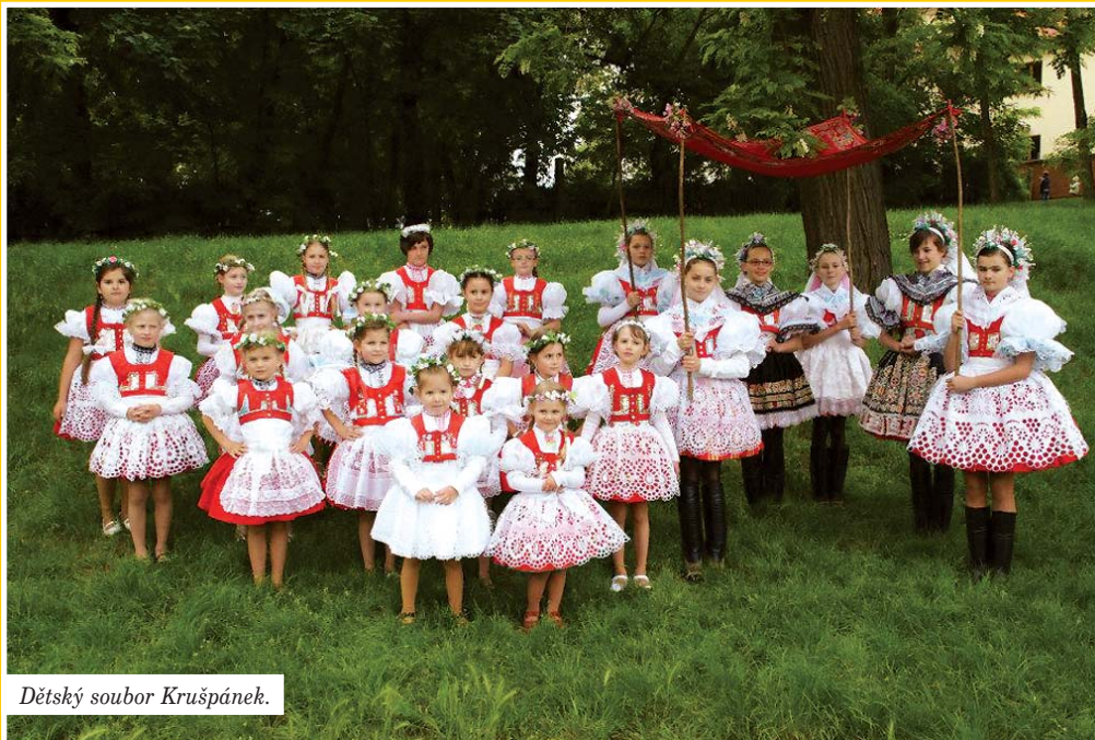
Dětský soubor Krušpánek.