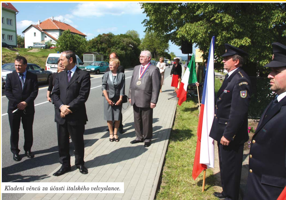
Kladení věnců za účasti italského velvyslance.