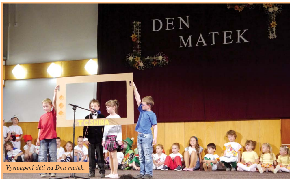
Vystoupení dětí na Dnu matek.