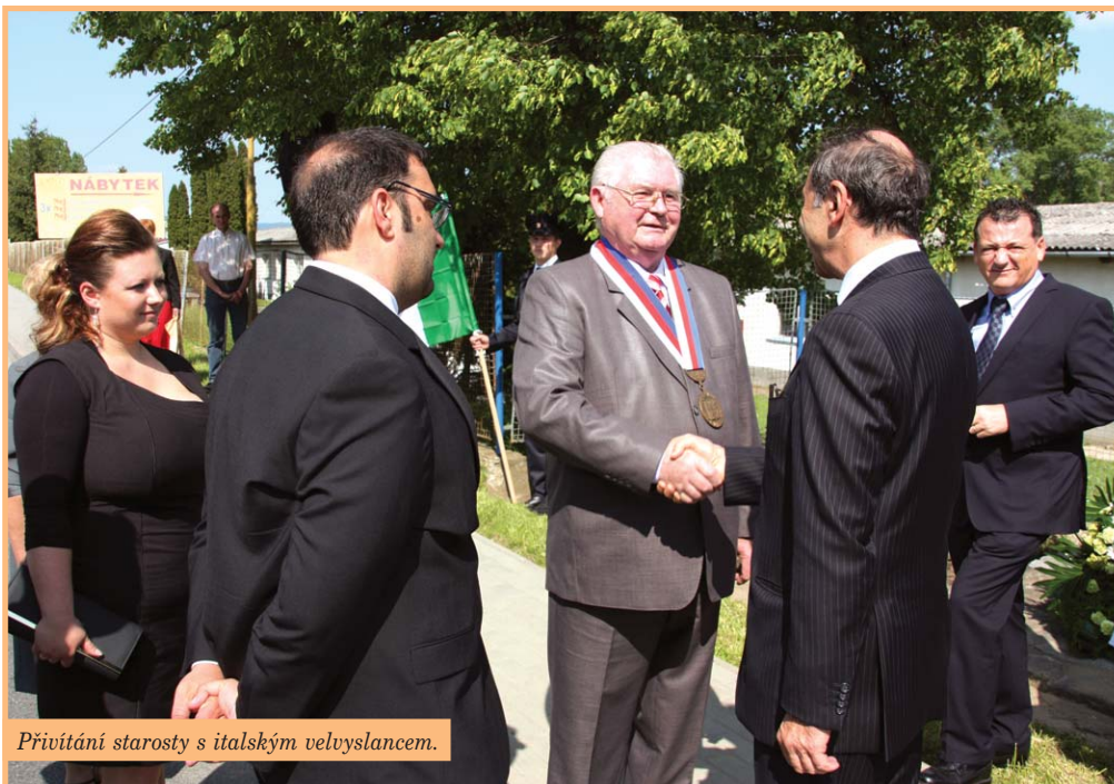
Přivítání starosty s italským velvyslancem.

Jednání s italskou ambasadou o účasti na financování a na postavení nového památníku na místě ve Vrbátkách je toho jasným důkazem. Chci tím ubezpečit majitele pozemků na Barákách ve Svatobořicích, že tam obec žádá jatka, nebo