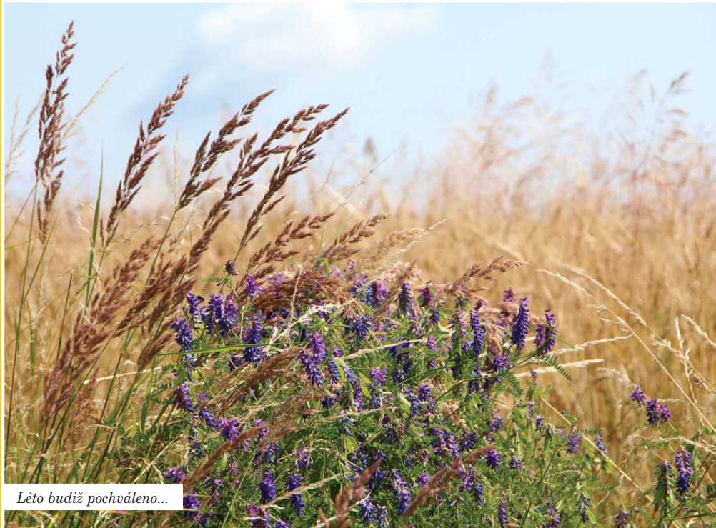
Léto budíž pochváleno...