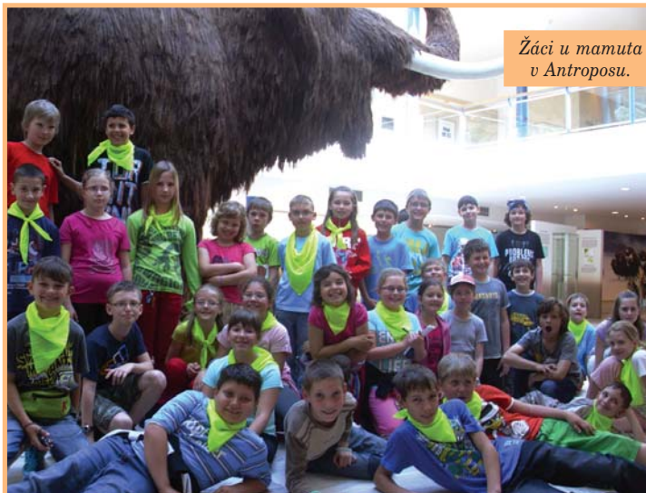
Žáci u mamuta v Anthroposu.

V tomto roce byly cyklovýlety obohaceny o ekoaktivitu směřující k lepšímu poznání přírody a k výchově dětí k získání potřeby přírodu chránit. Cestou jsme navštívili například biocentrum U Jezera v povodí řeky Kyjovky, kde se žáci dozvěděli informace o hnízdicích ptácích. Trasa měřila třicet dva