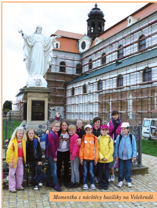
Momentka z návštěvy baziliky na Velehradě.

V poledne jsme se shromáždili před kostelem v Mistříně. Překvapilo mě velké množství dětí, byly nadšené, pobíhaly kolem dokola a nic si nedělaly v počínajícího deště.