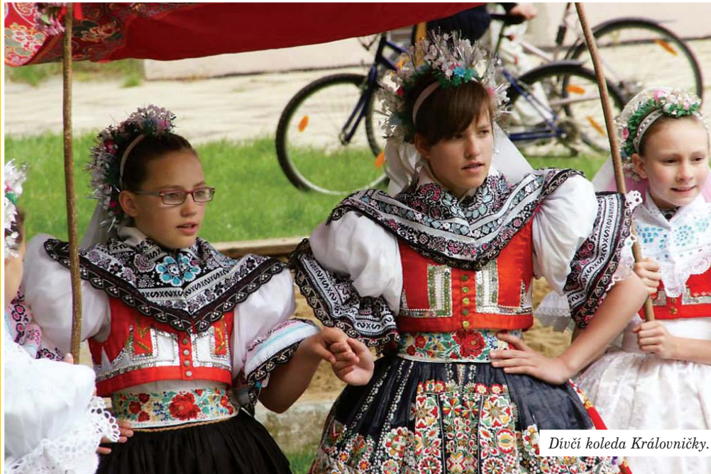
Divčí koleda Královničky.