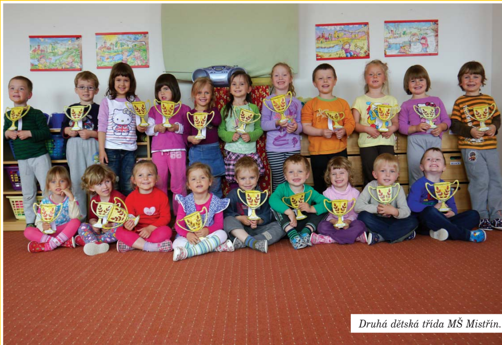
Druhá dětská třída MŠ Mistřín.