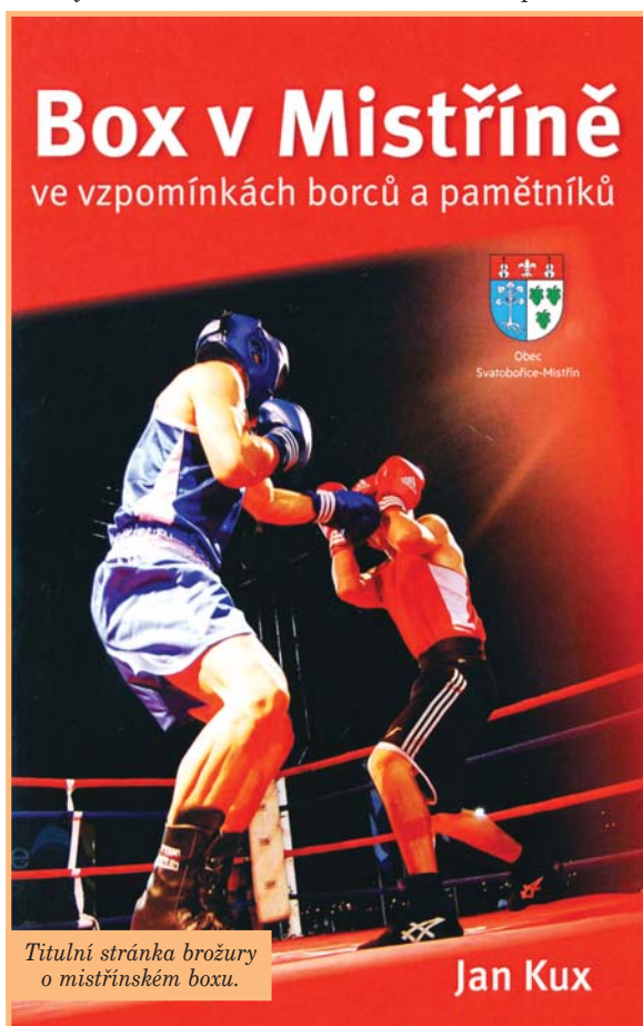
Titulní stránka brožury o mistrýnském boxu.