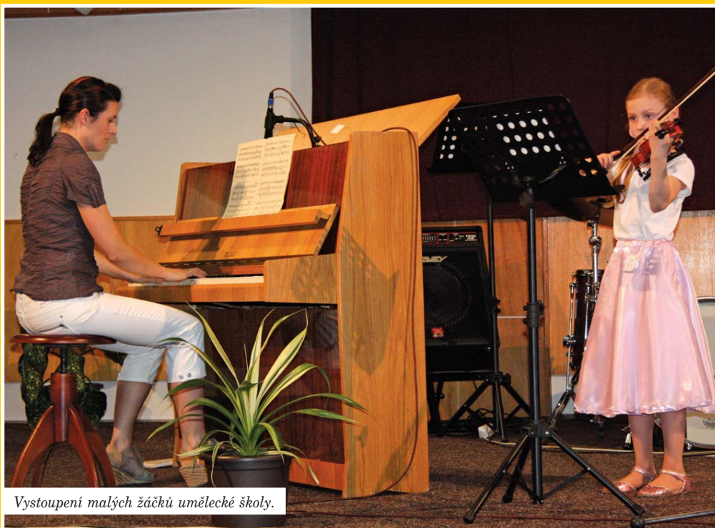
Vystoupení malých žáčků umělecké školy.