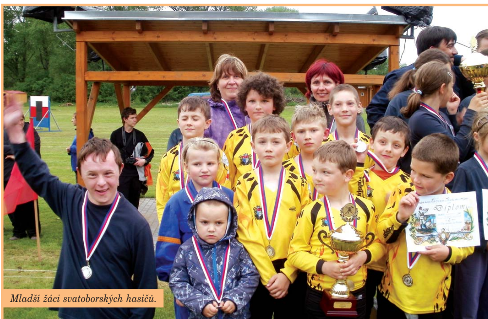
Mladší žáci svatoborských hasičů.

Po zimních měsících jsme se pustili do jarního úklidu okolí hasičky, uspořádali sběr starého železa, ale především jsme začali trénovat venku.