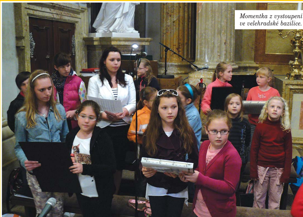
Momentka z vystoupení ve velehradské bazilice.