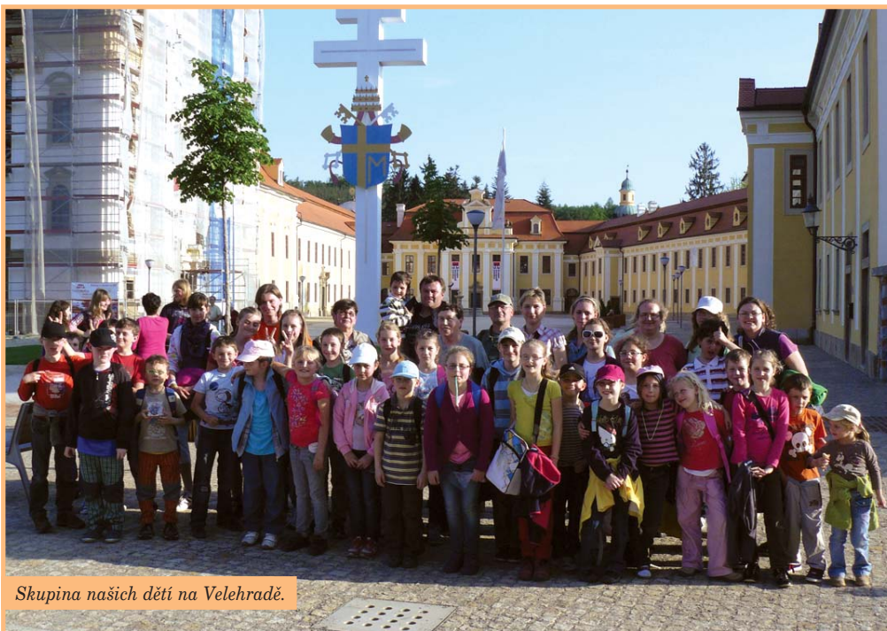
Skupina našich dětí na Velehradě.

Dne 8. 5. 2013 v den svátku Panny Marie Prostřednice všech milostí se vydalo na Velehrad téměř 40 dětí a 20 dospělých z naší farnosti.