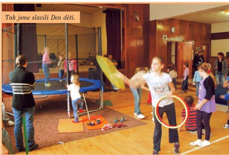
Tak jsme slavili Den dětí.

Dne 5. května obecní úřad slavnostně otevíral v Mistříně petangové hřiště a hned se konal první