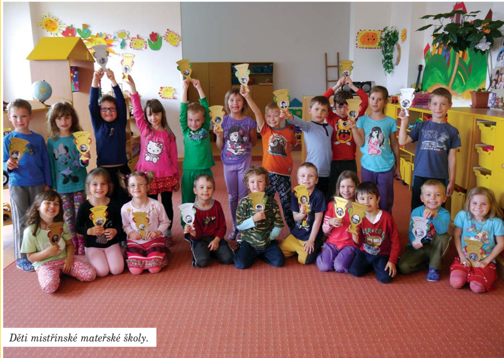
Děti mistřinské mateřské školy.