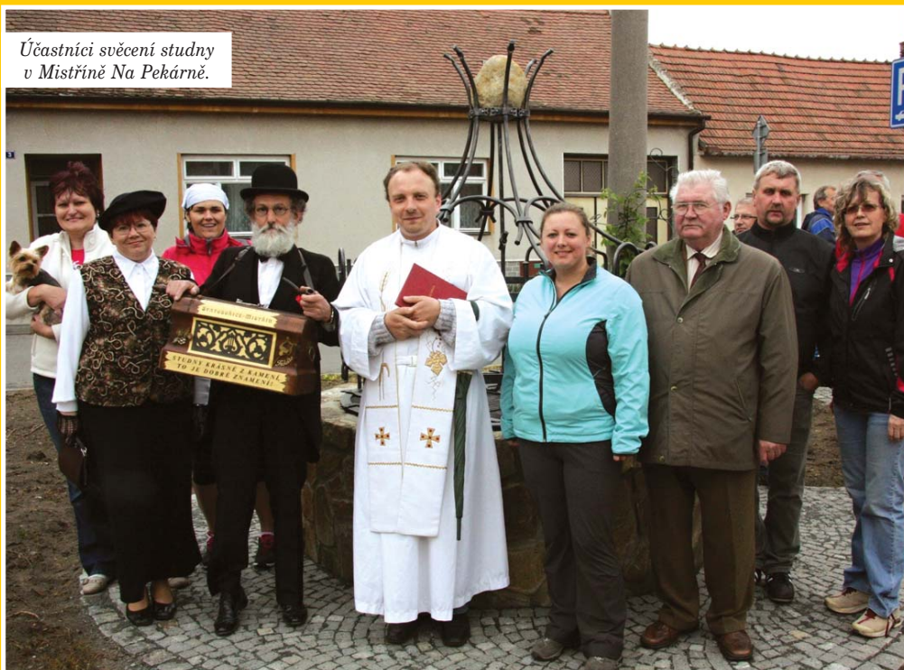
Účastníci svěcení studny v Mistříně Na Pekárně.