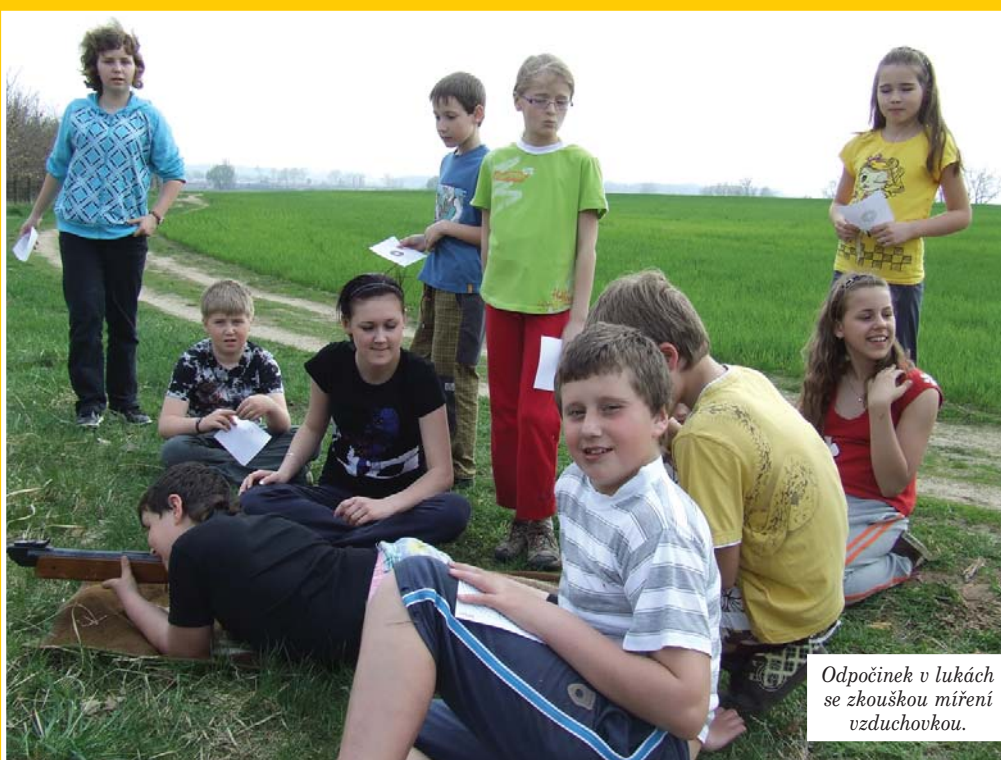
Odpocínek v lukách se zkouškou míření vzduchovkou.