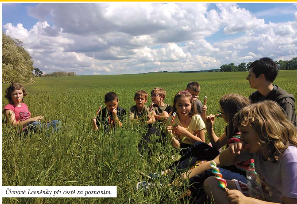
Členové Lesněnky při cestě za poznáním.