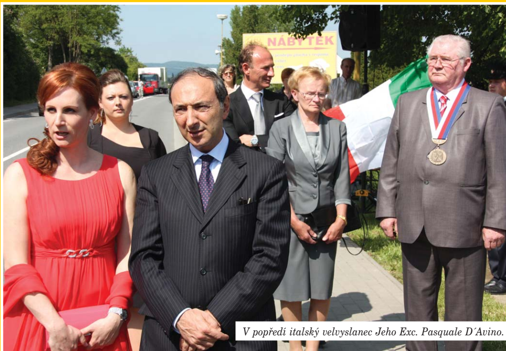
V popředí italský velvyslanec Jeho Exc. Pasquale D'Avino.