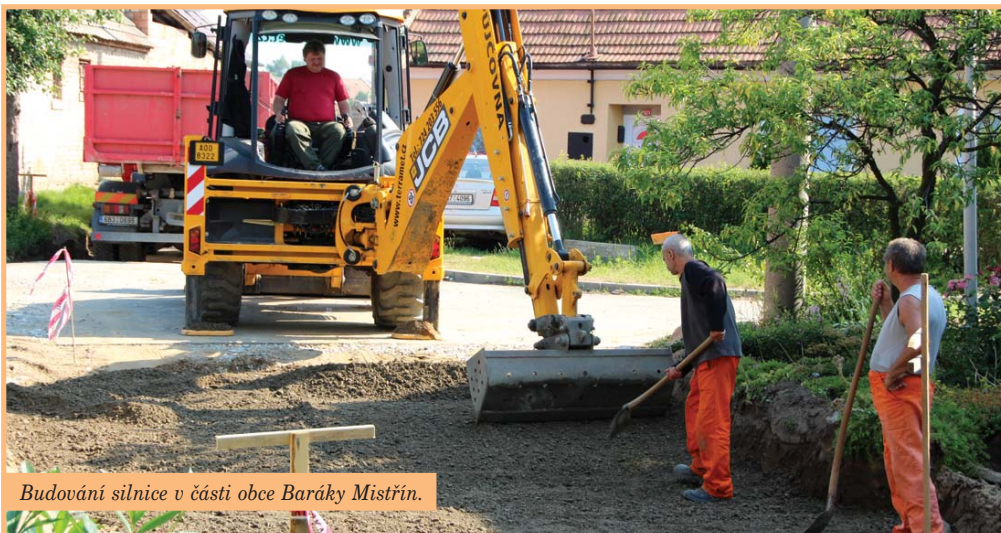
Budování silnice v části obce Baráky Mistřín.