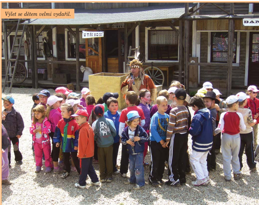
Výlet se dětem velmi vydařil.