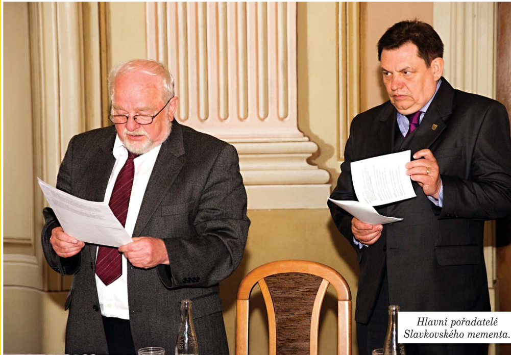
Hlavní pořadatelé Slavkovského mementa.