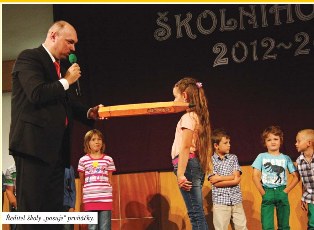
Ředitel školy „pasuje“ prvňáčky.